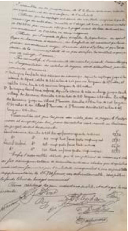
Augmentation du calibre de certaines conduites (26/04/1925)